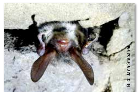
Eine Bechsteinfledermaus ist eine für den Steigerwald charakteristische Art.

Die sechs Landkreisberater appellieren an Besitzer von alten Bierkellern, diese bitte für Fledermäuse zugänglich zu machen. Ein ca. acht Zentimeter hoher und 40 Zentimeter breiter Einflugschlitz, im oberen